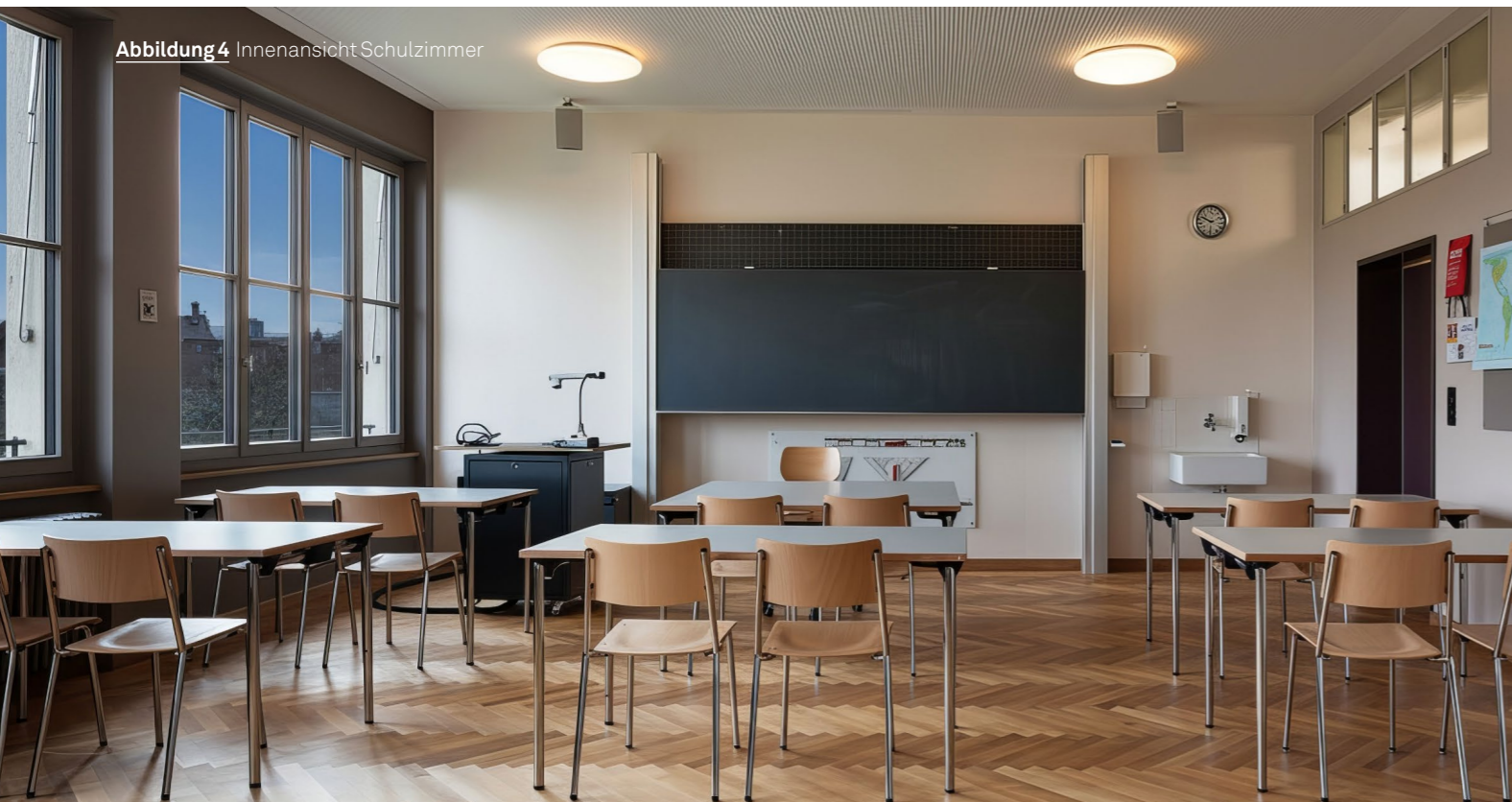
Abbildung 4 Innenansicht Schulzimmer